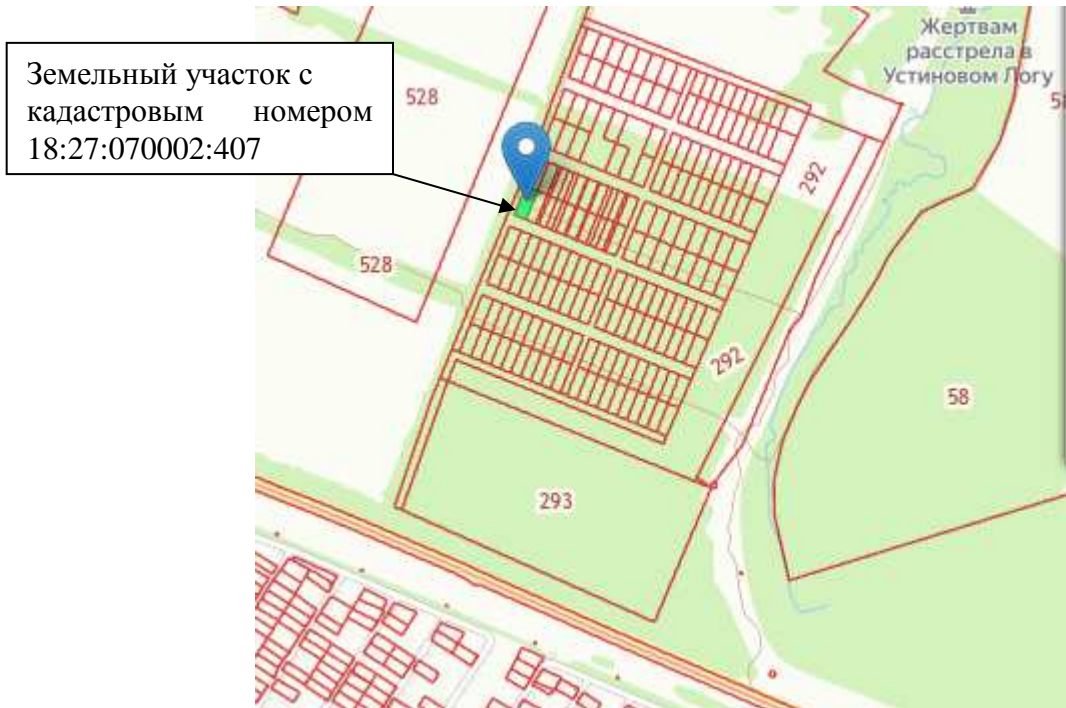
Рис.1. Схема расположения земельного участка в кадастровом квартале

Кадастровый номер земельного участка: 18:27:070002:407.