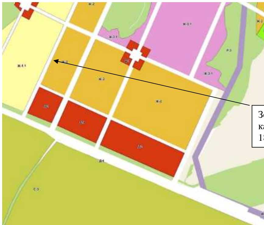
Рис.2. Выкопировка из ПЗЗ г.Воткинска.

Земельный участок с кадастровым номером 18:27:070002:407